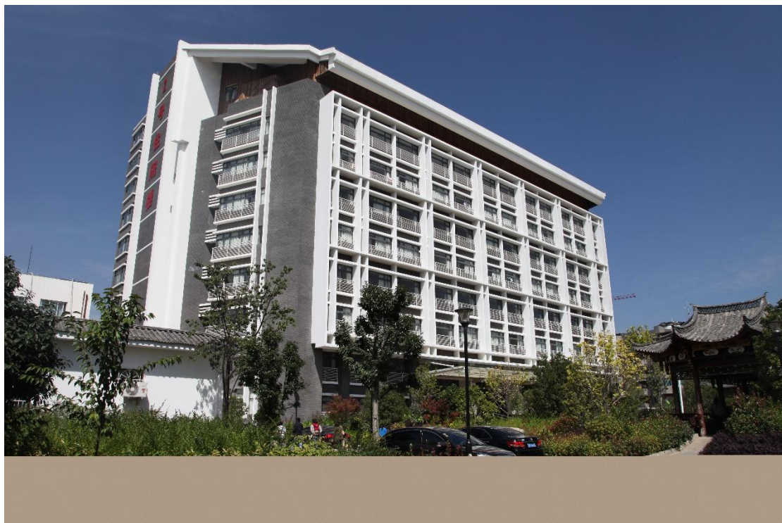
（医院 2 号住院楼）

丽江市人民医院始建于 1949 年 7 月，1952 年改称丽江专区人民医院，1973 年更名为丽江地区人民医院，2003 年更名为丽江市人民医院，2018 年 9 月被评定为国家“三级甲等”综合医院。是全市唯一一所集医疗、科研、教学、预防、保健、康复等功能为一体的国家三级甲等综合医院，是昆明理工大学非直属附属医院，是省、市内多所大中专院校的教学和实习医院，是丽江市全科医生临床培养基地，同时承担着丽江市 120 医疗急救、感染疾病诊疗、艾滋病防治、健康体检等工作任务。