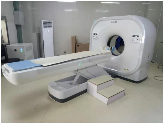
X 射线计算机体层摄影设备 (飞利浦 16 排 Access CT)