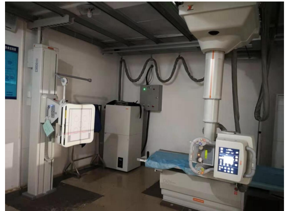
美国 Carestream Health INC Evolution DR 系统