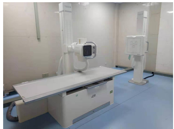
数字化医用 X 射线摄影系统