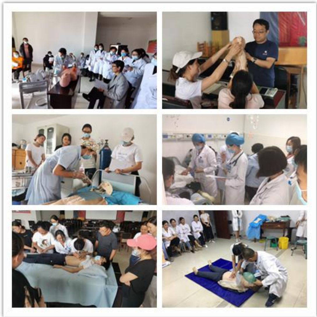
1、电除颤 2、儿童生长发育评价 3、吸痰术 4、教学查房 5、体格检查 6、徒手心肺复苏