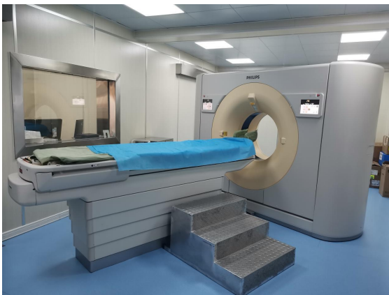
X 射线计算机体层摄影设备