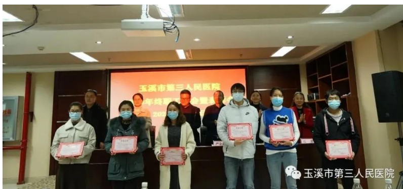
表彰 2019 年、2020 年优秀规培学员