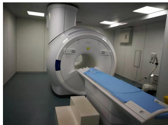
医用磁共振成像系统