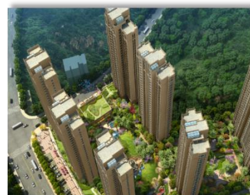
十堰-惠隆·九号公馆