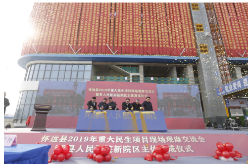
2019年12月19日 主体封顶仪式