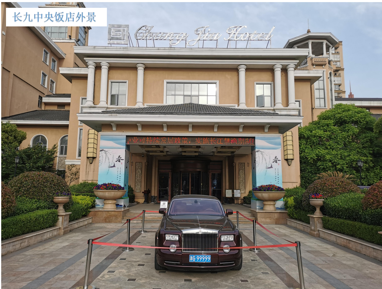
长九中央饭店外景