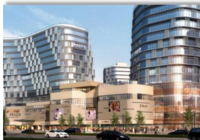
杭州-杭州之江长九中心