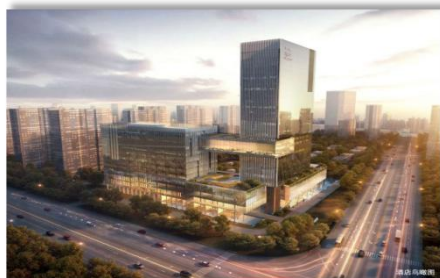
泰州兴化-长安路九号