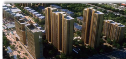
石家庄-长九中心·公园9号